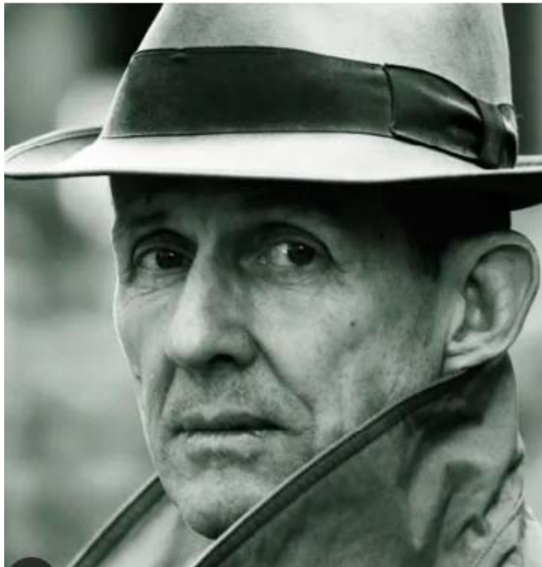
Romain Slocombe.

Septième et antépénultième volume de la fresque, Sadorski et le docteur Satan nous amène à l'automne 1944, dans une France libérée où police gaulliste et milices patriotiques communistes traquent les collaborateurs de la veille. Sadorski, qui a réussi à passer entre les mailles des filets résistants a dû, pour une